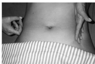
Figura4: Teste do piparote

- Teste do piparote: com uma das mãos, o examinador golpeia o abdome com piparotes, enquanto a outra mão, espalmada na região contra lateral, capta ondas líquidas que se chocam com a parede abdominal.