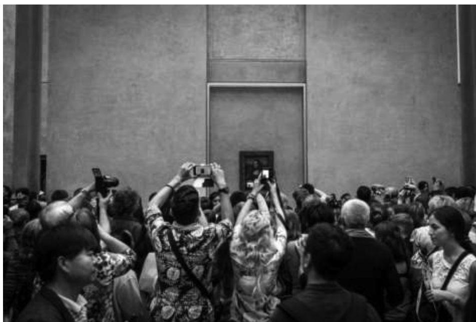
Figura 3: Visitantes diante da Mona Lisa na Salle de La Joconde, no Louvre, Paris.