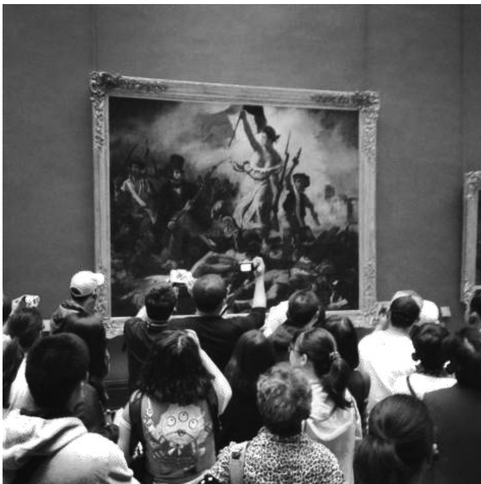
Figura 2: Visitantes diante do quadro Liberdade guiando o povo de Delacroix, Museu do Louvre.