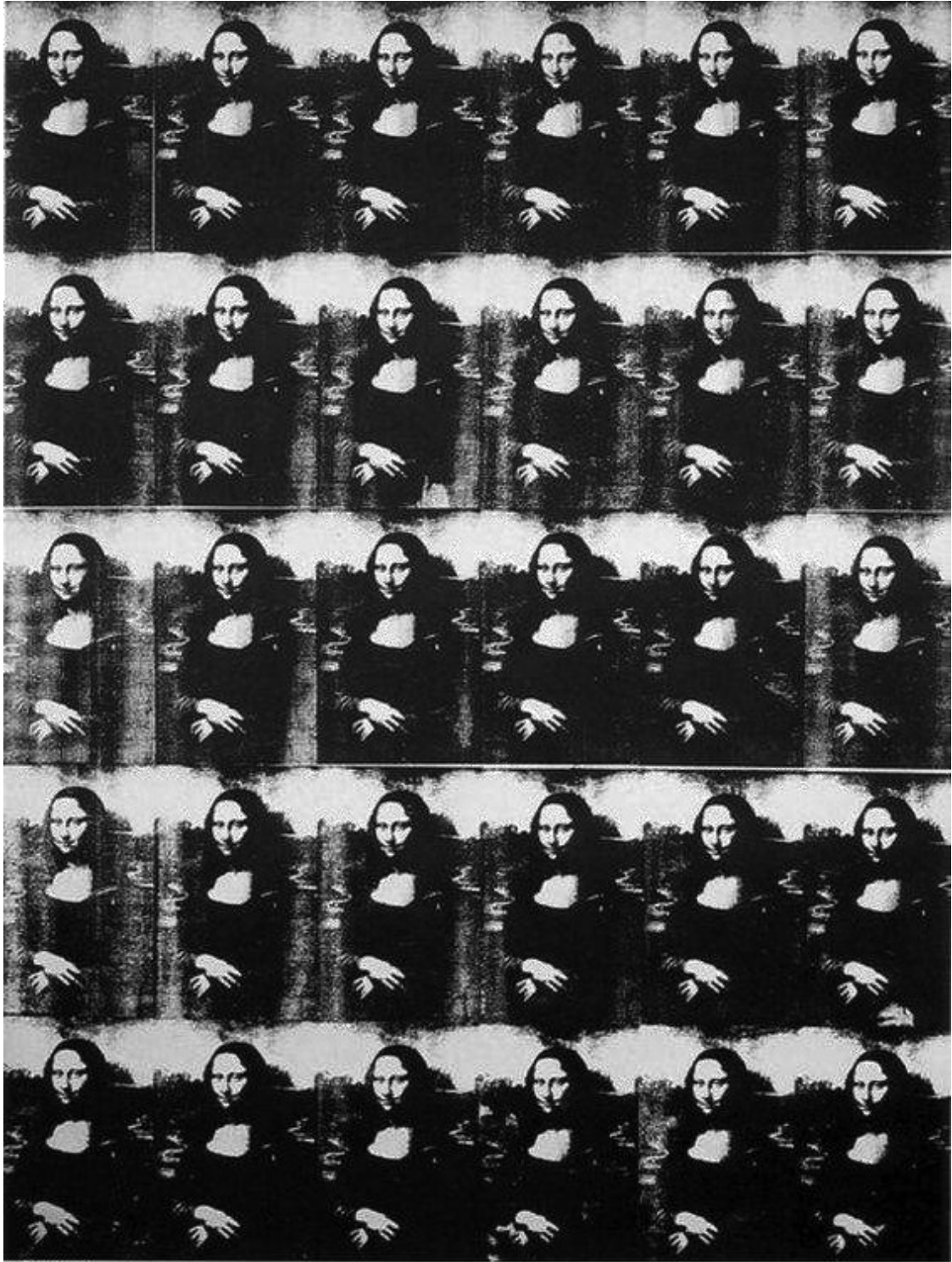
Figura 5: Andy Warhol, Thirty Are Better Than One , 1963. Disponível em: https://br.pinterest.com/pin/353462270734914902/ . Acesso em: 10 de Julho de 2016.