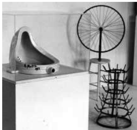
Figura 6: Exemplo de ready-made composto por peças de uso cotidiano como roda de bicicleta, um porta garrafas, um banquinho de cozinha e um mictório, usados numa exposição como desconstrução de padrões artísticos. Disponível em: http://noholodeck.blogspot.com.br/2011/06/ready-made-marcel-duchamp-1887-1968.html . Acesso em: 04 de julho de 2016.

O artista Marcel Duchamp foi um dos pioneiros no processo de desconstruções sobre padrões artísticos estabelecidos. No começo do século XX, a introdução dos chamados ready-made 6 foi a estratégia usada por Duchamp para afrontar os paradigmas artísticos (CONDE, 2013).