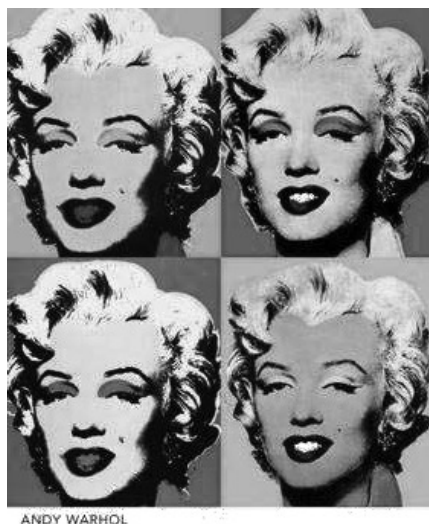
Figura 7: Exemplo 2 de reprodução de Warhol. Figura de Marilyn Monroe. Disponível em: https://br.pinterest.com/pin/304415256035069580/ . Acesso em: 04 de julho de 2016.