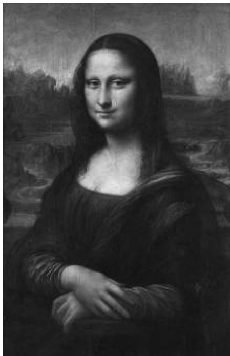
Figura 1: Mona Lisa. (Retrato de Mona Lisa, La Gioconda, Leonardo da Vinci.).

La Joconde para os franceses, La Gioconda para os italianos e Mona Lisa para a maioria dos países, o quadro de setenta e sete centímetros de altura e cinquenta e três centímetros de largura pintado por Leonardo da Vinci um dos principais mestres do Renascimento, é considerado o mais famoso do mundo. (SASSOON, 2004).