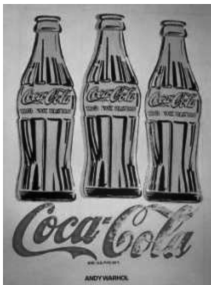
Figura 6: Exemplo de reprodução de Andy Wahrol com a marca Coca-Cola. Disponível em: https://br.pinterest.com/pin/59391288807738161/ . Acesso em: 04 de Julho de 2016.

A Pop Art utiliza imagens já prontas para criar seus quadros ou emprega elementos do cotidiano em seus feitos. Seria uma manifestação artística que escolhe imagens que já foram processadas pelo coletivo e já estão presentes no imaginário popular. O interesse do artista encontra-se no desprendimento do objeto, colocando-o na monotonia da repetitividade, em um processo de despersonalização ou retirando-o do seu ambiente usual, desconstruindo a cena comum. (AMORIM; SILVA, 2013, p.3)