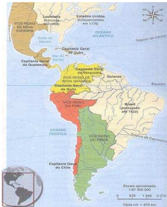
Figura 2: Mapa da América antes do processo de independência.