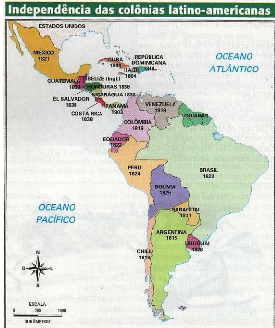
Figura 3: Mapa da América depois do processo de independência.