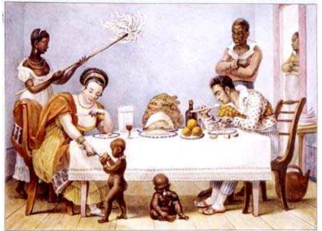
Figura 2: Uma família brasileira. Quadro de Jean Batiste Debret.