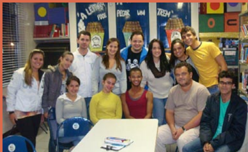
Equipe multidisciplinar desenvolve atividades de saúde, educação e arte com estudantes

intimidade entre os alunos e professores, os acadêmicos da UFJF e os atores da companhia de dança.” O vice-diretor também afirma que o resultado da ação foi satisfatório. “Saúde, educação e arte se materializaram em um projeto dentro de uma escola pública. Isso é fundamental para nosso trabalho como educador.”