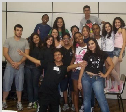
Integrantes do projeto dividem o tempo entre os estudos e o teatro