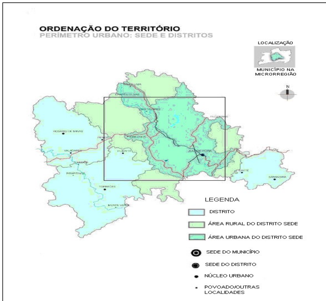
Mapa 1 – Juiz de Fora: sede e distritos 7

Seguindo o modelo de outras cidades 8 , Juiz de Fora adotou o planejamento estratégico para si, já que: