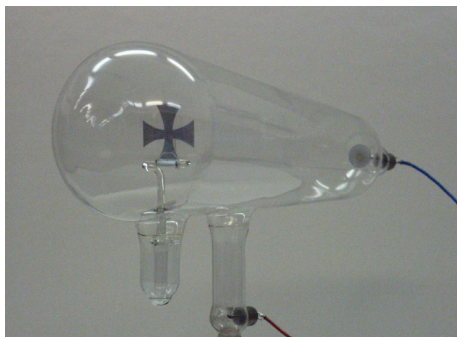
Fig. 6.4.1 Ampola para geração de raios catódicos (tubo de Crookes)

Em 1858 o matemático e físico Julius Plücker 1 descobriu os raios catódicos, aqueles que vimos na discussão da força magnética e que aparecem nas figuras 6.1.2 e 6.1.3. Ele, junto com seu aluno Johann Hittorf 2 , constatou que numa passagem de corrente elétrica num gás rarefeito sai algum tipo de radiação do eletrodo negativo. Esta radiação se propaga em linha reta e objetos densos feitos de metal ou vidro produzem sombra com estes raios. Sir William Crookes 3 também chegou a este resultado e sugeriu que estes raios seriam íons negativos.