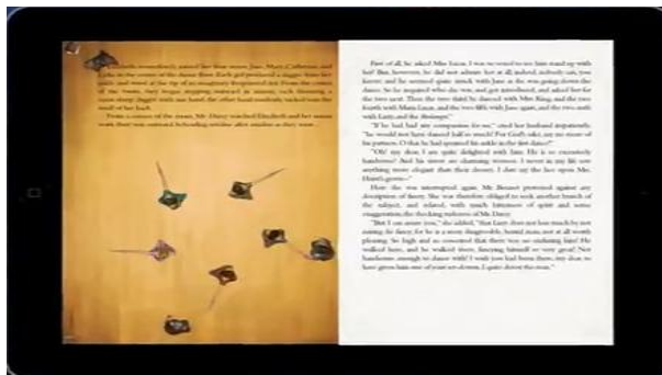
Figura 2: Pride and Prejudice and Zombies (à esquerda) e Pride and Prejudice (à direita).

Esteticamente, por se apoiarem a um grande número de imagens, as obras hipermidiáticas, em sua grande maioria, terão como fio condutor da narrativa e desenvolvimento da leitura os próprios elementos visuais inseridos no aplicativo. No ebook Pride and Prejudice and Zombies , por exemplo, o leitor é transportado para um mundo animado e interativo onde é possível ler “páginas” utilizando a luminosidade de uma vela, ou ainda, abrir cartas, tocar músicas do século XIX, explodir o cérebro de zumbis e encher a tela de seu aparelho de sangue e horror.