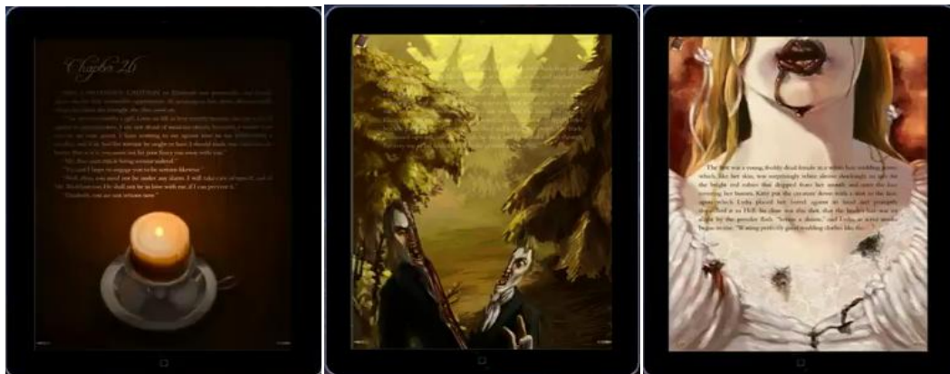
Figura 3, 4 e 5: Imagens do ebook interativo Pride and Prejudice and Zombies .

Esteticamente, por se apoiarem a um grande número de imagens, as obras hipermidiáticas, em sua grande maioria, terão como fio condutor da narrativa e desenvolvimento da leitura os próprios elementos visuais inseridos no aplicativo. No ebook Pride and Prejudice and Zombies , por exemplo, o leitor é transportado para um mundo animado e interativo onde é possível ler “páginas” utilizando a luminosidade de uma vela, ou ainda, abrir cartas, tocar músicas do século XIX, explodir o cérebro de zumbis e encher a tela de seu aparelho de sangue e horror.